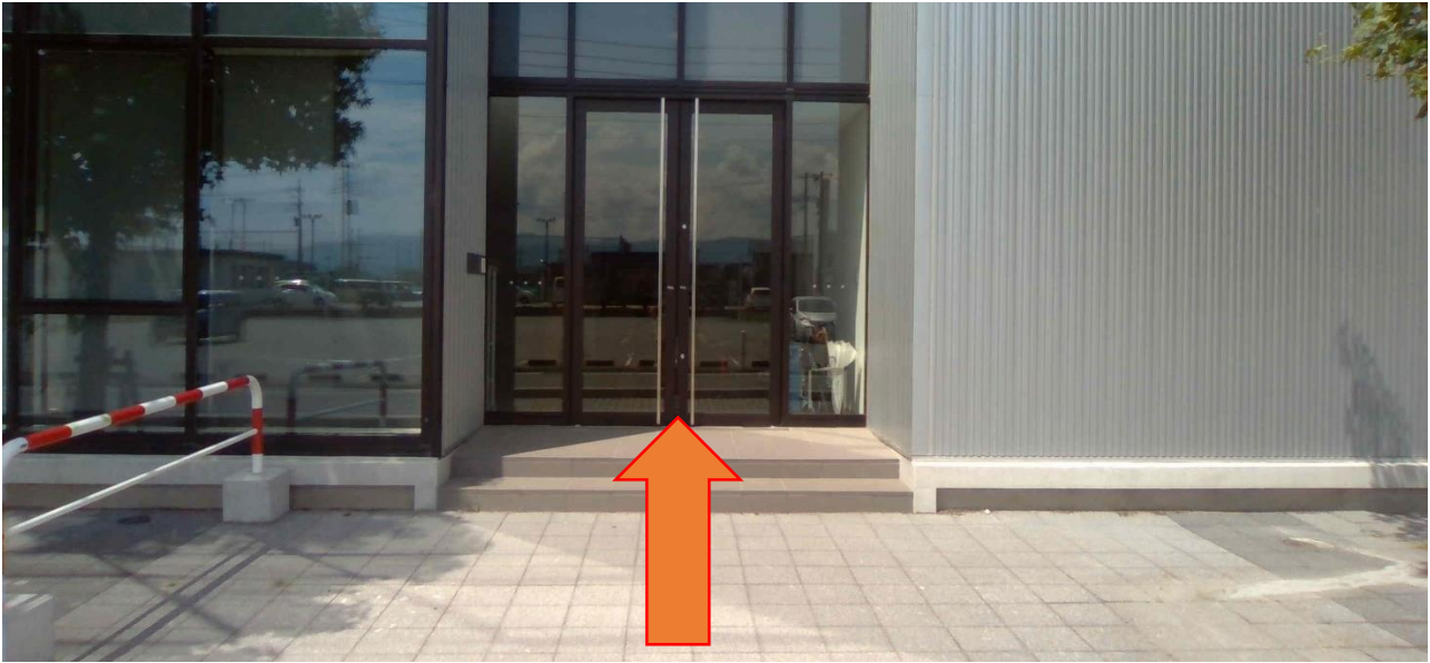
2日目の玄関はこちらのみでお願いします(常時開放でお願いします)